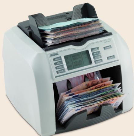
rapidcount T 275